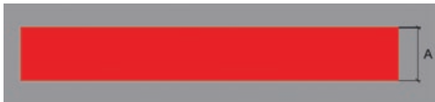
Grens Manoeuvring Area