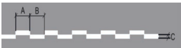
Kruising Randweg met Taxilane